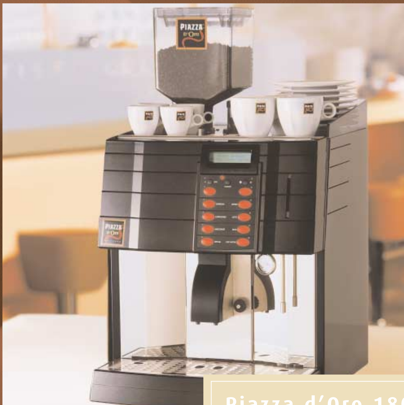
Piazza d'Oro 180